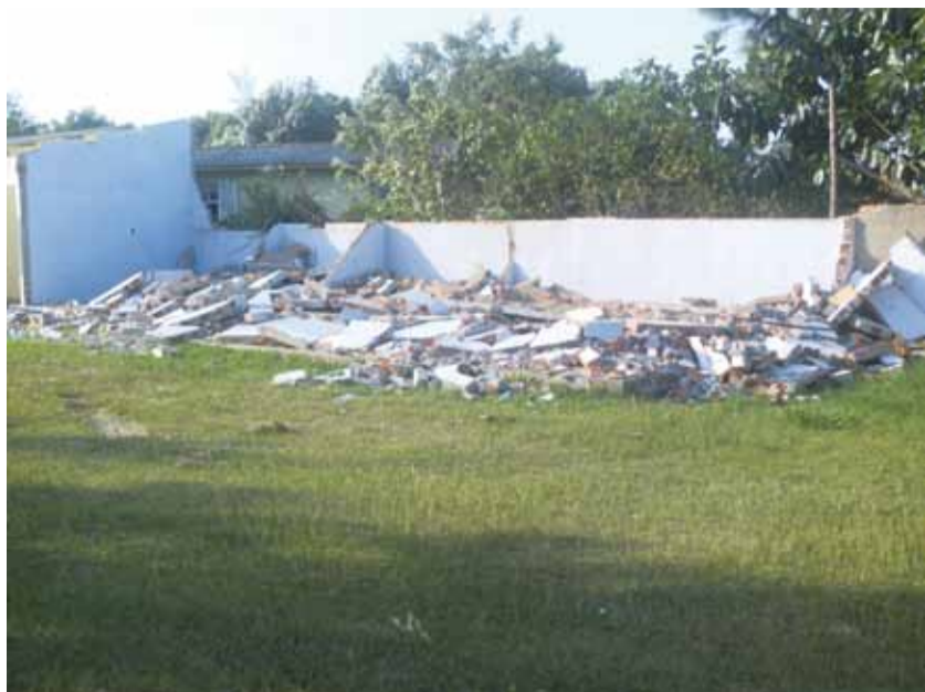
Paredes são derrubadas e dá-se início à concretização do sonho