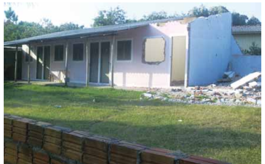
Domolição começou no mês de abril

Nós temos a certeza de que você sentirá o mesmo prazer e satisfação que esta diretoria quando puder realmente desfrutar da sua Colônia de Férias. Ela estará com suas portas abertas a todos os sócios em dia com a entidade e é extensiva a seus dependentes diretos, companheiro, companheira e filhos e, como vem sendo feito até agora, basta simplesmente que você agende a semana que melhor atender as suas necessidades.