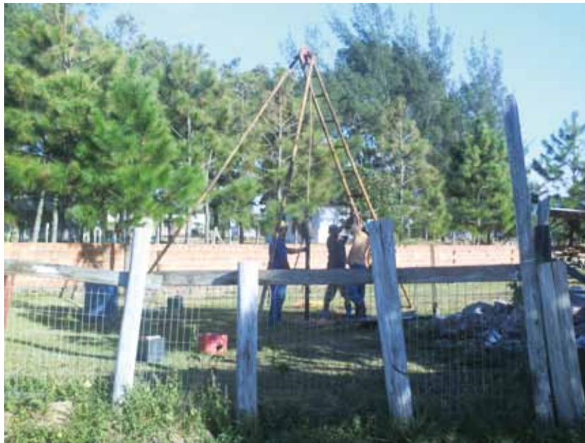
Obras de estaqueamento