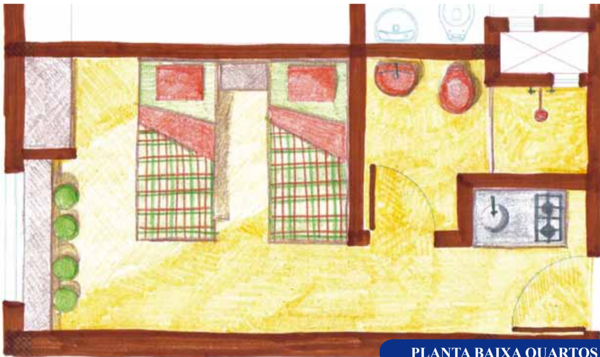
PLANTA BAIXA QUARTOS

Os quartos também vão propiciar todo o conforto para os usuários. De uma maneira compacta, a distribuição dos móveis está bastante equilibrada, colocando ao seu dispor camas, mesa, cadeiras, guarda-roupa, fogão e geladeira, com cozinha e banheiro individuais e você poderá desfrutar de maior privacidade sem perder o mínimo conforto.