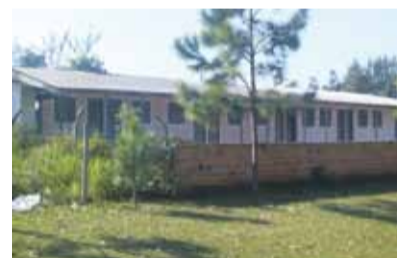
A Colônia de Férias em seu primeiro e segundo ano de uso

O primeiro passo foi a compra do terreno, efetuado em 2007, com nove apartamentos térreos. Agora estamos efetuando as obras de construção da nova Colônia e elas já estão em pleno desenvolvimento. A princípio serão finalizadas as construções do pavimento térreo e do segundo piso. Posteriormente o terceiro andar será erguido, dando por concluído o atual projeto. No entanto, por possuir estrutura planejada para a construção de mais andares, quem sabe, no futuro, outros pavimentos poderão ser erguidos. Isso só depende de você.