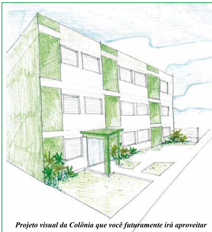
Projeto visual da Colônia que você futuramente irá aproveitar

A direção ao aprovar a construção desse projeto pensa somente na categoria e de maneira responsável está administrando o dinheiro que arrecada ao longo do ano. Mesmo com outras despesas somadas a estes custos da obra, estamos administrando nossos recursos financeiros para que parte da Colônia já possa ser desfrutada ainda neste verão de 2010, e ainda teremos um saldo positivo nas contas bancárias do Sindicato. Isso comprova o quanto o dinheiro da categoria é administrado de forma responsável.