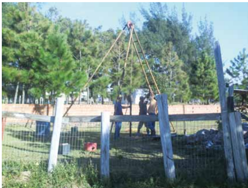
Obras de estaqueamento