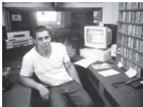
Levado ao ofício pelo irmão está há 22 anos no meio radiofônico